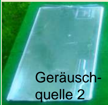
Geräusch- quelle 2